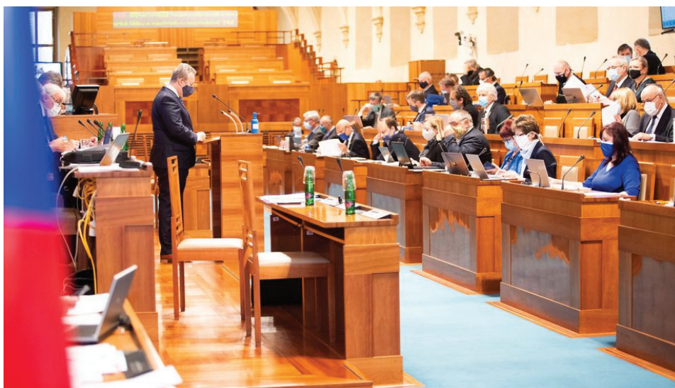
Senát opět se opět sešel v neúplném složení, část mých kolegů byla „v záloze“, aby nás v případě potřeby mohli vystřídat.