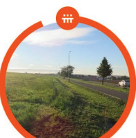
NAUČNÁ STEZKA Zakřany