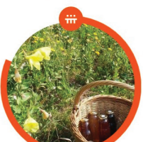
SUŠÁRNA BYLIN Nová Ves nad Popelkou