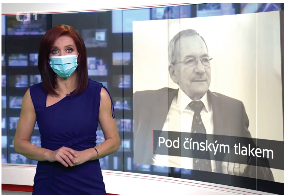
Bývalý předseda Senátu Jaroslav Kubera si vždy stál za svými názory. Od své cesty na Tchaj-wan nechtěl ustoupit ani po nátlaku Číny a Hradu. Byl to důvod jeho náhlého skonu?

Vše se zřejmě vyhroutil tři dny před smrtí předsedy Kubery, kdy byl spolu se svou manželkou pozván na amba-