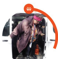
VÝBAVA VOZŮ Třebíč