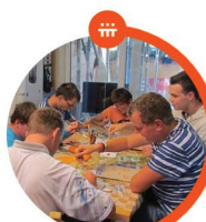
ROZŠÍŘENÍ PRACOVNÍŠTĚ Tetín