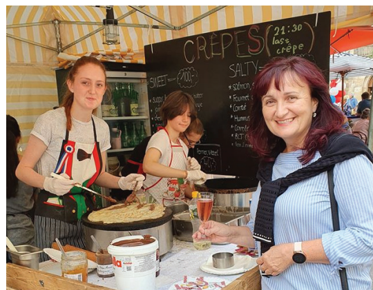
Bon appetit, mes amis. Viva la France!

Letošní trhy se konaly již potřinácté a datum konání nikdy není zvoleno náhodně. Vždy se jedná o období kolem 14. července. Tento den je pro Francouze významným státním svátkem, jímž si připomínají dobytí Bastily. Tato událost je v ní mána jako konec starého režimu a začátek Velké francouzské revoluce.