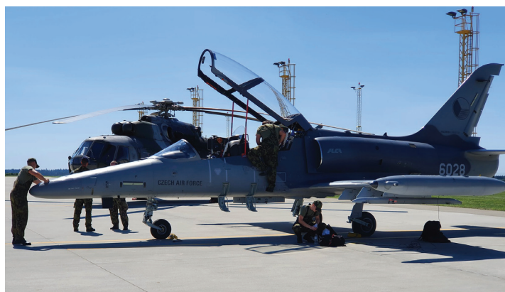
Do Náměště se opět na chvíli vrátily Albatrosy.