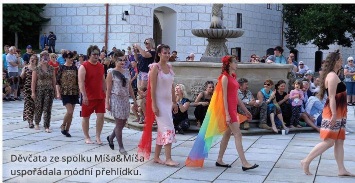
Děvčata ze spolku Míša&Míša uspořádala módní přehlídku.