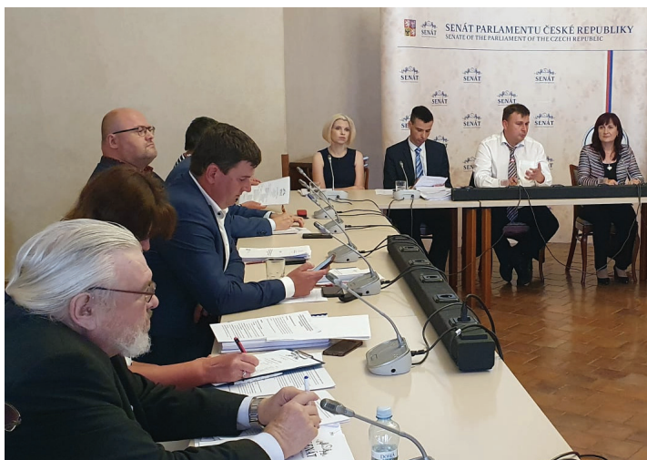
Momentka ze zasedání podvýboru

Osmého července se konala 11. schůze senátního Podvýboru pro dopravu a energetiku. Ač byly na programu „pouze“ tři body, jejich projednání nám zabralo celé dopoledne. Začali jsme novelou zákona o silniční dopravě, která zapracovává předpisy EU a která se zabývá především dodržováním přestávek a dob odpočinku řidičů, kontrolou dodržování těchto přestávek, vydáváním karet podniku a změnou trestní způsobilosti. Jeho schválení bylo bez větších problémů a já osobně jsem ráda, že všechny složky, kterých se tato novela týká, ji vnímají veskrze pozitivně. Dle Ředitelství služby dopravní