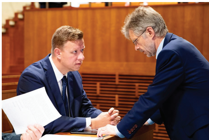
Senátor Hynek Hanza je primátorem Teplic, kde byl v doplňovacích volbách zvolen za zesnulého předsedu Senátu Jaroslava Kuberu. Na snímku s jeho nástupcem Milošem Vystrčillem.