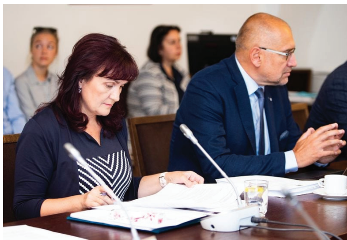
Na Výboru pro záležitosti EU jsme také jednali o nadcházejících prezidentských volbách v Bělorusku, které proběhnou 9. srpna.

Šestnáctého července proběhla další schůze Výboru pro záležitosti EU. Zabývali jsme se aktualizovaným návrhem víceletého finančního rámce (VFR) na období 2021-2027 a balíčkem návrhů na zmírnění dopadů pandemie COVID-19, o nichž poté mimořádně jednala Evropská rada.