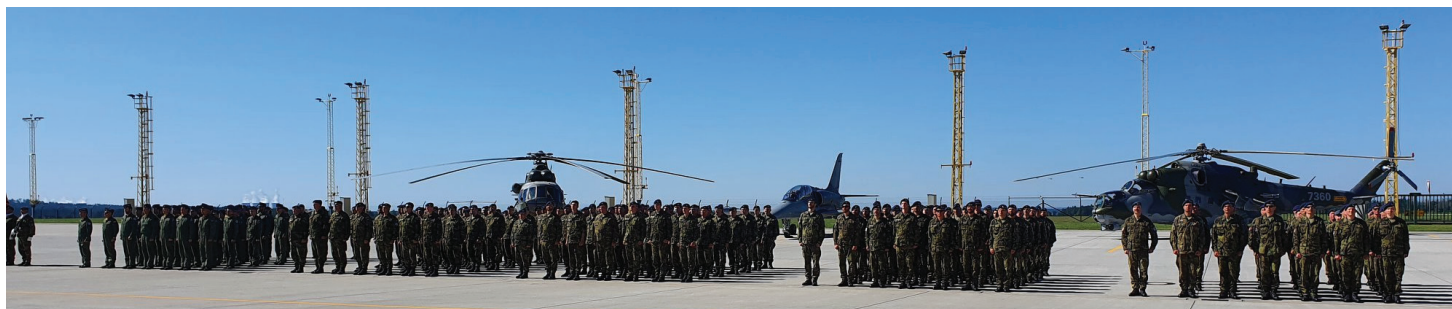
Slavnostní nástup celé 22. základny vrtulníkového letectva v Náměšti nad Oslavou